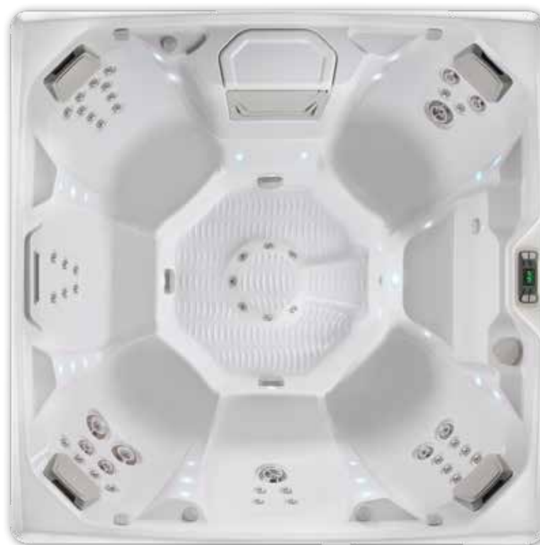
Coque Pulse en Blanc alpin.