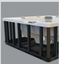
Base et structure en polymère