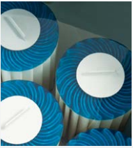
Filtration à 100 % Circulation SilentFlo