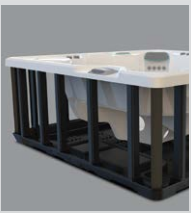
Base et structure en polymère