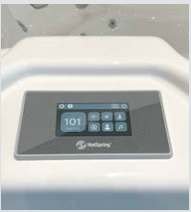
Panneau de commande tactile LCD couleur