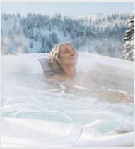
Efficacité énergétique supérieure