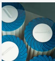
Filtration à 100 % Circulation SilentFlo