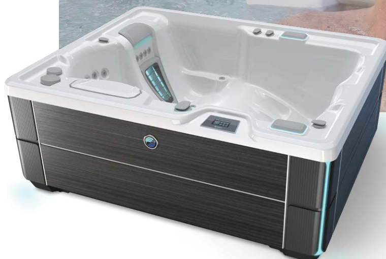
Avec coque blanc alpin et habillage Blackwood

Personnes Places Jets Tension 3 places Lounge 22 Jets 230 V