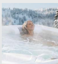
Efficacité énergétique supérieure