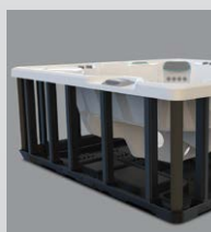
Base et structure en polymère