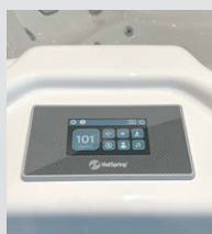
Panneau de commande tactile LCD couleur