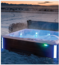
Isolation haute densité FiberCor®