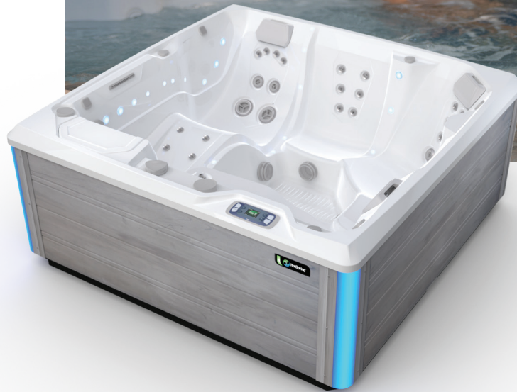
Avec coque Blanc alpin et habillage Gris côtier