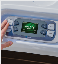
Panneau de commande LCD couleur